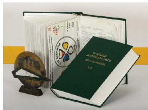
Księga Pro Memoria