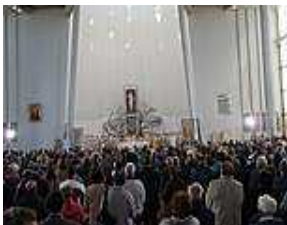
Msza w Łagiewnikach

Migawki z Biegu wokół Polski, Księga Pro Memoria wręczona kardynałowi St. Dziwiszowi podczas papieskiej Mszy w Łagiewnikach.